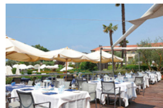
Das 4-Sterne Hotel Caesius Terme & Spa mit großzügigem Wellnessbereich liegt im malerischen Ort Bardolino am Gardasee.