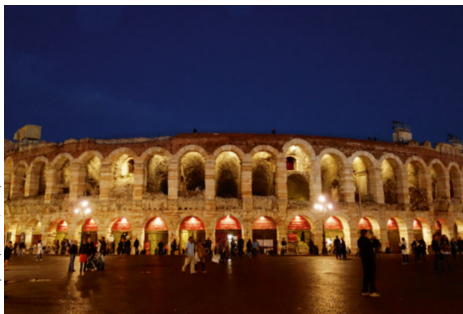
Am Samstag-Abend Besuch der Oper «Il Trovatore» von Giuseppe Verdi in der Arena von Verona.

Druckfehler und kurzfristige Änderungen vorbehalten.