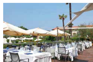
Das 4-Sterne Hotel Caesius Terme & Spa mit großzügigem Wellnessbereich liegt im malerischen Ort Bardolino am Gardasee.