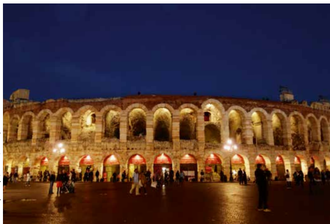
Am Samstag-Abend Besuch der Oper «Turandot» von Giacomo Puccini in der Arena von Verona.

Druckfehler und kurzfristige Änderungen vorbehalten.